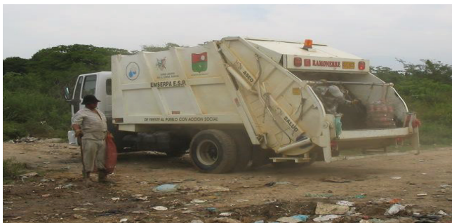
Foto: Vehículo Compactador Utilizado Para el transporte y recolección de Residuos