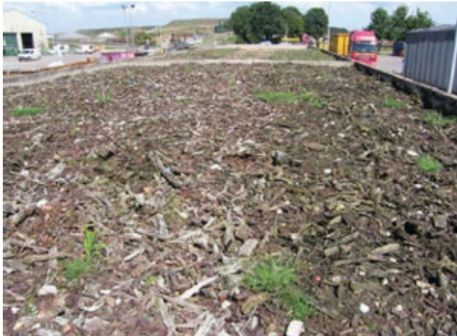
Imagen: Modelo tomado de la red