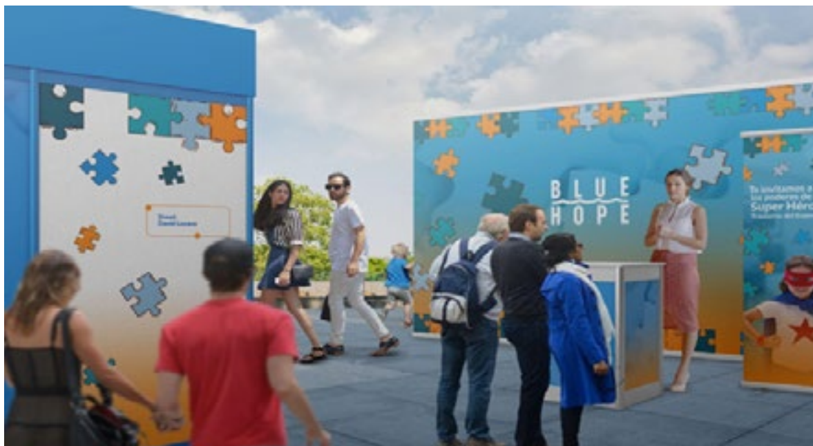
Figura 2: Demostración de estrategia transmedia, en medios tecnológicos y sociales. Integración de la familia y la sociedad por medio de un evento

Cabe destacar que esto no solo debe realizar a través de medios digitales, sino que, por el contrario, debe haber un apoyo conjunto en el que los medios tecnológicos y sociales se unan para crear un enlace entre las familias. Así como se puede observar en la Figura 2, se muestra la interacción dentro de un evento abierto al público, en el que no solo conocerán más sobre este trastorno, sino que también conocerán personas con este diagnóstico, que no han sido limitadas y les han permitido crecer mediante sus talentos y cualidades.